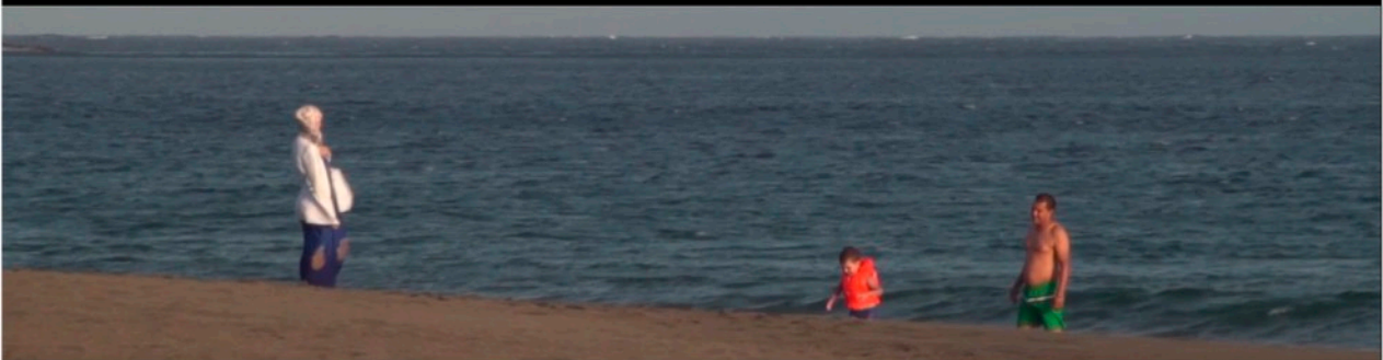
Frames from Cuerpos In.Visibles

Documental presentado como work-in-progress en el Congreso Internacional "Artes y diversidad" en Murcia, España, en noviembre de 2019.